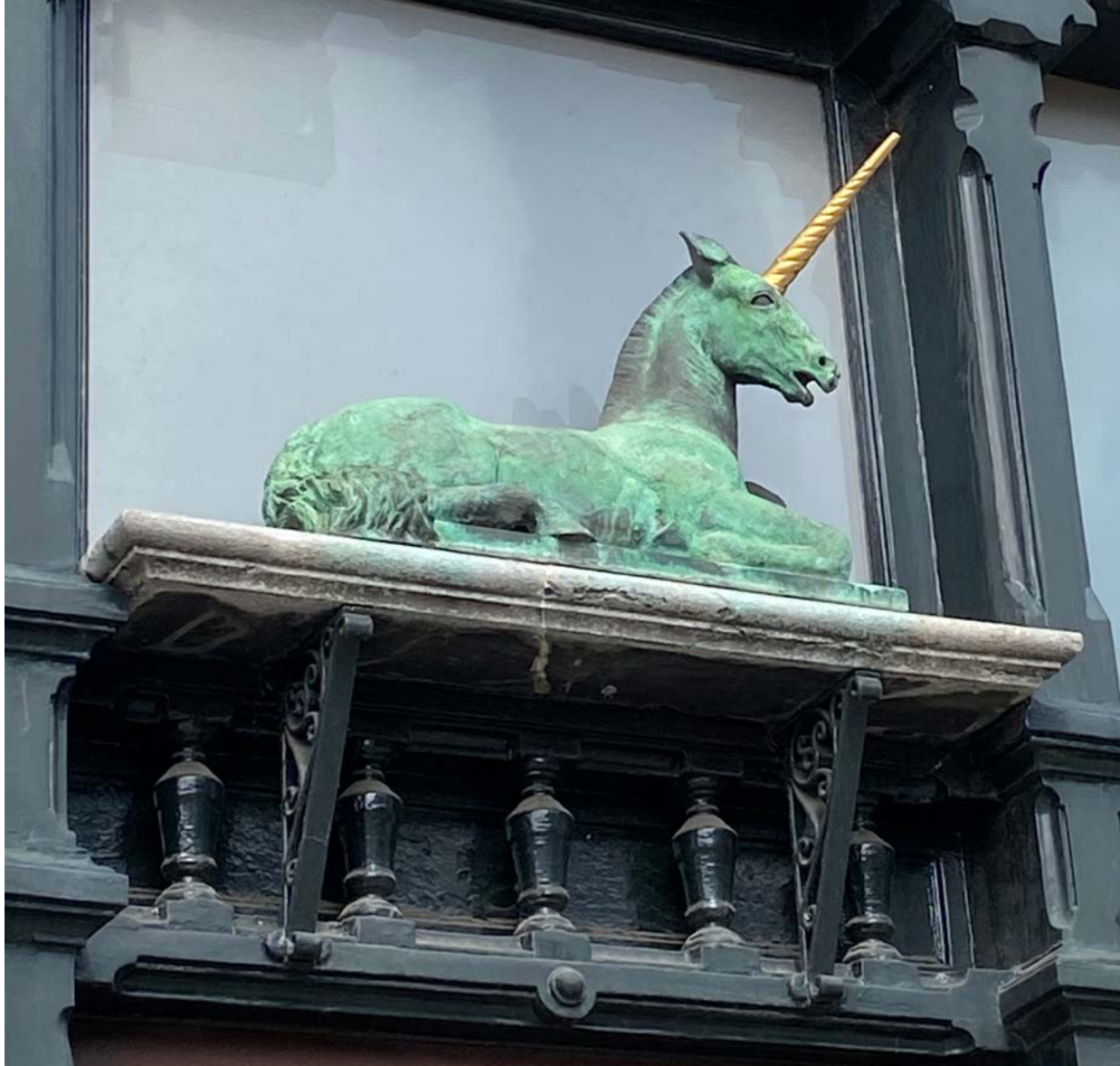
De eenhoorn boven de apotheek in Den Bosch